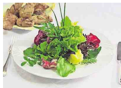
Salatbouquet und frische Brötchen.

emulgieren. Anschliessend den Essig beifügen und die Hühnerbouillon einrühren. Zucker, Salz, Pfeffer beifügen. Zum Schluss die gehackten Zwiebeln, Knoblauch, Basilikum, Liebstöckel und Estragon dazugeben – wiederholt alles gut rühren. Die sämige, braune Sauce zwei Tage im Kühlschrank ziehen und fermentieren lassen. Anschliessend das Ganze durch ein grobes Sieb seihen. Die Feststoffe mit Gummihandschuhen nochmals gut «ausdrücken» und dadurch den Ertrag steigern. Im Anschluss die ganze Sauce durch ein feines Sieb giessen. Vielleicht nach «persönlichem Gusto» nachwürzen. Die Sauce wird auch gerne für Wurst- oder Siedfleischsalat serviert. (uok)