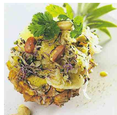
Sauerkrautsalat mit Ananas und Bananen

Zutaten für 4 Portionen: 750g rohes Sauerkraut (abgetropft), 50g Rotkabbisprossen, 6EL kaltgepresstes Rapsöl, Saft einer Orange, 2 Bananen, 1 Baby-Ananas, 50g Cashewkerne, 50g ungeröstete Erdnüsse, 1 Bund Koriander Zubereitung: Sauerkraut, Sprossen, Öl und Orangensaft mischen. Bananen in Scheiben schneiden und unter das Kraut mischen. Ananas halbieren, Fruchtfleisch herauslösen und klein würfeln. Ananaswürfelchen, Cashewkerne, Erdnüsse und Koriander (grob gehackt) unter das Kraut mischen. In den Ananasschalen anrichten. Aus: «Rohe Lust», Fona Verlag, Lenzburg